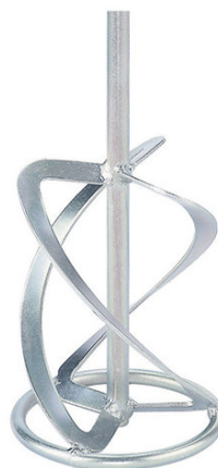
doporučený typ míchadla

Instrukce a informace v tomto technickém listu jsou výsledkem našich zkoušek a zkušeností. Protože různorodost materiálů a podkladů a počet jejich možných kombinací a způsobů aplikací je nesmírně vysoký, není možné obsáhnout jejich úplný popis. Prospekt může jen právně nezávazně poradit, zpracování výrobku je však nutno přizpůsobit konkrétním podmínkám. Výrobce není odpovědný za škody způsobené nedodržením instrukcí nebo použitím produktu k nevhodnému účelu. Ujistěte se, že postupujete podle nejnovějšího vydání technického listu výrobku. Ty jsou k dispozici na naší webové stránce.